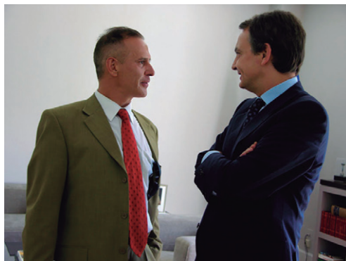
Con José Luis Rodríguez Zapatero en La Moncloa 2004

Reconozco que he tenido mucha suerte, he vivido la edad de oro del periodismo español, la que va de la muerte de Franco al nacimiento de Internet, cuando había más dinero y más libertad que ahora. Empecé en Ajoblanco , una revista libertaria y contracultural que era un chorro de aire fresco en la España de la segunda mitad de los años 1970, y luego estuve en Diario de Valencia y, sobre todo, treinta años en El País . Le estoy muy agradecido al periódico de la calle de Miguel Yuste, me ha permitido hacer muchas cosas que me apetecían: cronista de sucesos en Madrid, corresponsal de guerra en Beirut, delegado en Rabat, París y Washington, enviado especial como reportero o entrevistador en cuatro continentes.