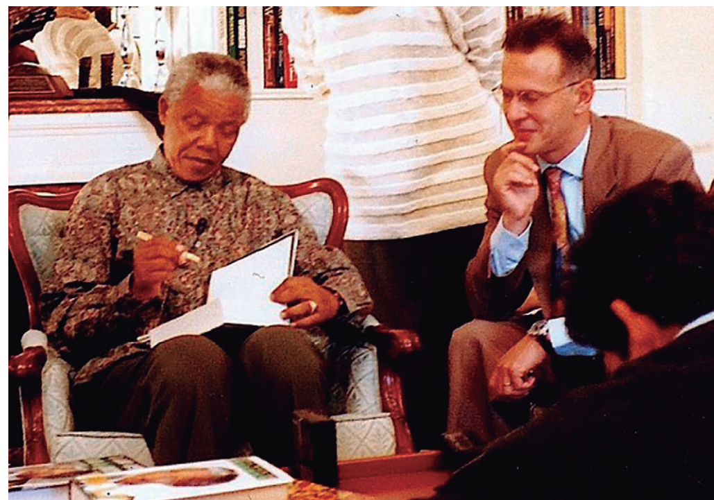
Con Nelson Mandela. Johannesburgo 1995

Por eso me irritan tanto esos ultraderechistas que, como el argentino Milei o la madrileña Ayuso, intentan apropiarse de la hermosa palabra libertad . Contaminar el planeta, privatizar la sanidad y la educación públicas, empobrecer aún más a los asalariados y los pensionistas, hacer este tipo de cosas para que unos pocos sigan enriqueciéndose, no es ejercer la libertad. No hay libertad si se daña a terceros, esto es de primero de sentido común.