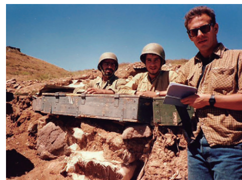
Guerra de Irán-Irak, 1987

No fue el televisor quien nutrió mi imaginario infantil, en mi casa no entró hasta que yo tenía once o doce años. Fueron, principalmente, las lecturas de novelas de aventuras, y supongo que esto marca una diferencia con las siguientes generaciones. Yo leía febrilmente las andanzas de Sandokán, el tigre de Malasia, contadas por Emilio Salgari, la maravillosa peripecia de La isla del tesoro , de Robert Louis Stevenson, y otras historias semejantes. Hoy las sigo leyendo, que conste. Tengo a los piratas como mis grandes héroes y a la Isla de la Tortuga como uno de los prototipos de la sociedad libertaria con la que siempre he soñado.