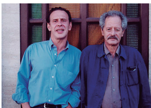
Con Mohamed Choukri. Tánger. 2002

Reconozco que he tenido mucha suerte, he vivido la edad de oro del periodismo español, la que va de la muerte de Franco al nacimiento de Internet, cuando había más dinero y más libertad que ahora. Empecé en Ajoblanco , una revista libertaria y contracultural que era un chorro de aire fresco en la España de la segunda mitad de los años 1970, y luego estuve en Diario de Valencia y, sobre todo, treinta años en El País . Le estoy muy agradecido al periódico de la calle de Miguel Yuste, me ha permitido hacer muchas cosas que me apetecían: cronista de sucesos en Madrid, corresponsal de guerra en Beirut, delegado en Rabat, París y Washington, enviado especial como reportero o entrevistador en cuatro continentes.