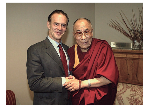
Con el Dalai Lama. Madrid. 2003

Pero puede colaborar puntualmente, claro que sí. Antes de que su avanzada edad lograra silenciarlo, Noam Chomsky hizo una gran aportación al pensamiento libertario contemporáneo. En los tiempos que vivimos, dijo, los libertarios no podemos sumarnos al desmantelamiento del Estado que predicán y practican los ultras invocando de modo espurio la palabra libertad . Al contrario, tenemos que defenderlo en aquellos aspectos, ahora en peligro, que hacen más soportable la vida de la gente. Pueden imaginarse que hablo de la sanidad, la educación y las pensiones públicas. No tengo dudas: no hay libertad sin Estado del bienestar.