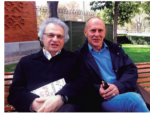
Con Amin Maalouf Casa árabe Madrid. 2012

Mencioné antes la posibilidad de que un libertario colabore con los socialdemócratas. Ahora diré que incluso es una obligación. Fui durante dos años (2004-2006) director general de Comunicación Internacional en La Moncloa de Zapatero, y jamás me he arrepentido de ello. Era otra faceta de mi oficio de periodista y, sobre todo, ZP era un tipo estupendo que hacía cosas que mejoraban la vida de nuestros compatriotas. Estoy orgulloso de la retirada de las tropas españolas de Irak, nos ahorró mucha vergüenza, mucho sufrimiento y