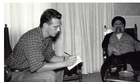
Con el líder de Hezbolá, Líbano. 1986