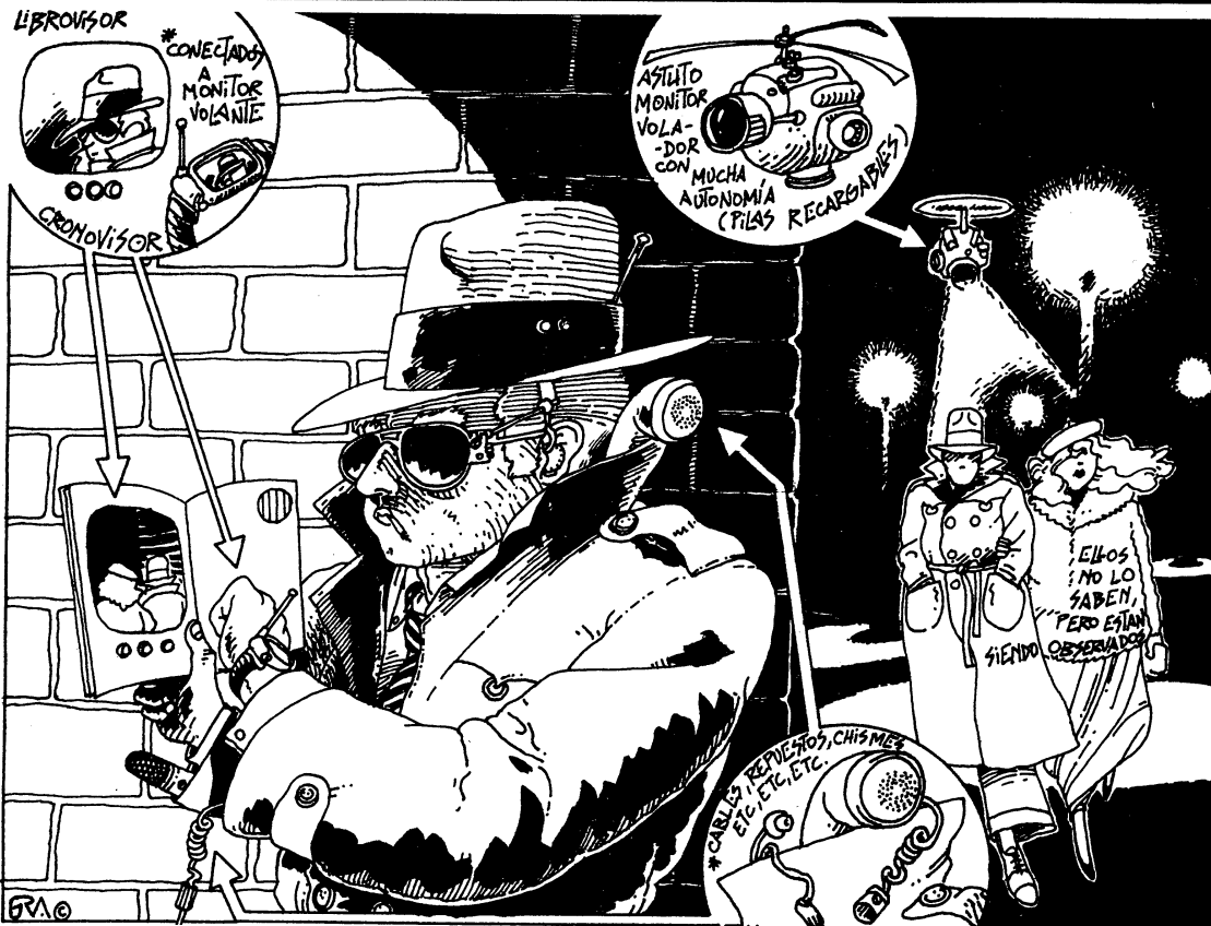
Los modernos investigadores privados acuden a la electrónica sofisticada para cumplir su trabajo.