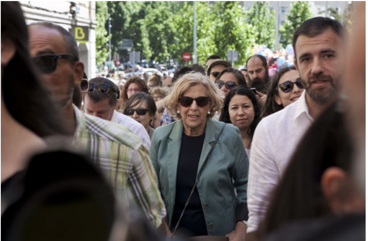
Manuela Carmena durante su campaña el pasado 15 de mayo.